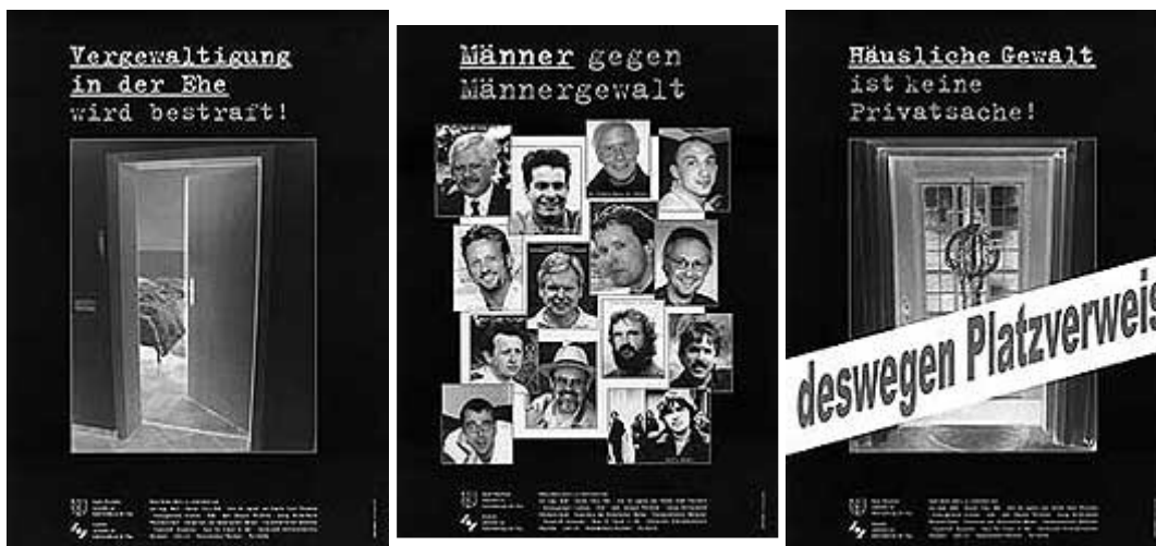
Plakatserie der Stadt Pforzheim, Leitstelle zur Gleichstellung der Frau, und des Enzkreises, Leitstelle zur Gleichstellung der Frau

Zur Bearbeitung spezifischer Fragestellungen hat die IMA drei Unterarbeitsgruppen (UAG) eingerichtet. Sie entwickeln Vorschläge und stellen Materialien zur Unterstützung der Praxis vor Ort zur Verfügung.