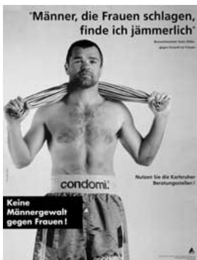
Plakatserie der Stadt Karlsruhe, Projektgruppe Häusliche Gewalt

Die Stadt- und Landkreise wurden auf Initiative des Sozialministeriums vom Städtetag bzw. vom Landkreistag gebeten, die Adressen und Telefonnummern der örtlichen Beratungsangebote und deren Anlaufstellen zusammenzustellen und an alle am Verfahren Platzverweis Beteiligten weiterzuleiten. Damit sollen die beteiligten Stellen in die Lage versetzt werden, die Opfer, aber auch die Täter auf das bestehende Beratungsangebot hinzuweisen, damit diese eine auf ihre spezielle Problemsituation ausgerichtete Beratung aufsuchen können.