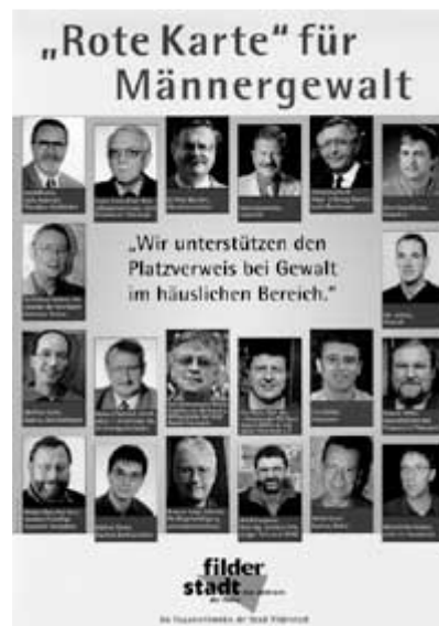
Plakat der Frauenreferentin der Stadt Filderstadt

Mit dem Platzverweis kann die akut bestehende Gefahr abgewehrt werden. Für weiterführende Beratungen stehen auf örtlicher Ebene sowohl allgemeine als auch spezifische Beratungsangebote zur Verfügung, zum Beispiel: