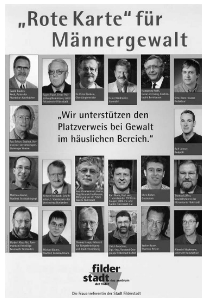
Plakat der Frauenreferentin der Stadt Filderstadt 38